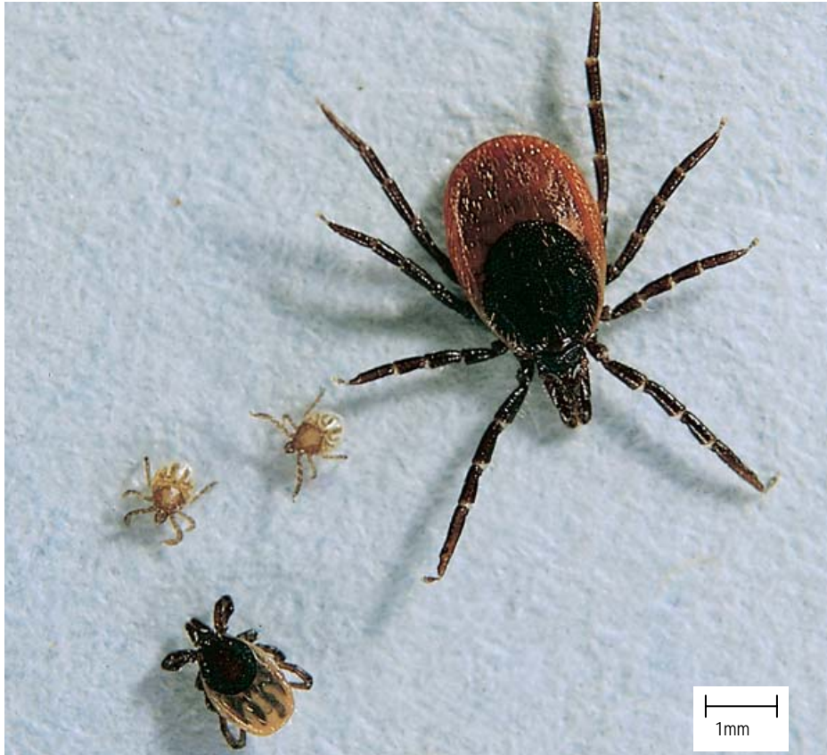
Abbildung 1: Ixodes ricinus (Holzbock): Zeckenstadien Larven adulte weibliche Zecke Nymphe