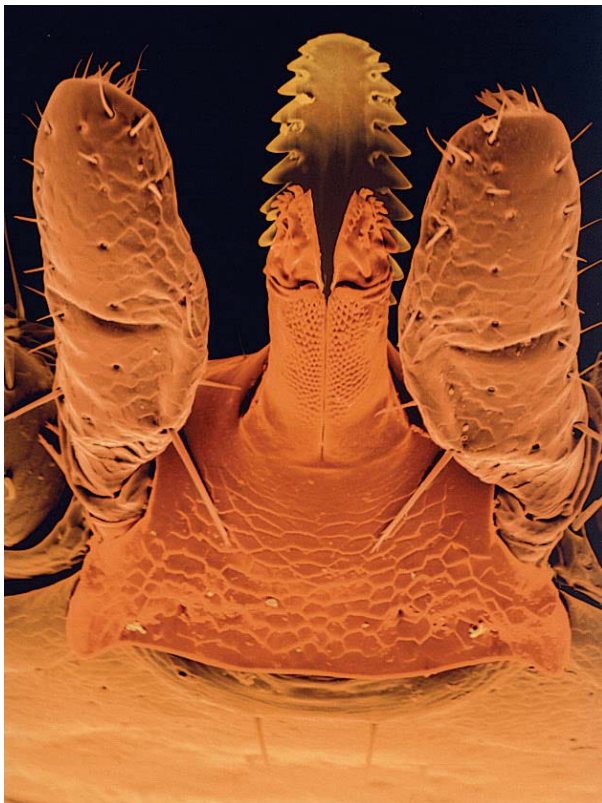
Abbildung 2: Stechapparat (Rostrum) der Zecke